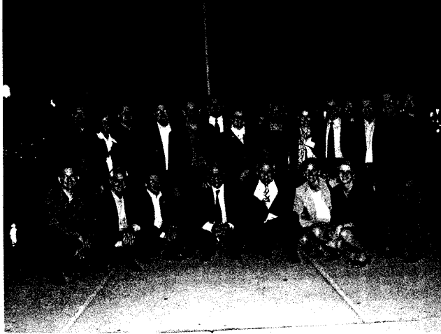
Slika 7: Predstavniki nacionalnih partnerskih organizacij EFQM

Urad je s pridobitvijo tako pomembnega statusa pridobil ekskluzivne pravice za prevajanje brošur EFQM in njihovo distribucijo in tudi uporabo drugih izdelkov in storitev v okviru medsebojnih dogovorov na območju Slovenije. Postali smo enakovreden partner EFQM in drugih nacionalnih partnerskih organizacij po Evropi v smislu interaktivnega sodelovanja in aktivne participacije, kar je potrební pogoj za enakopravno nastopanje proti drugim evropskim državam.