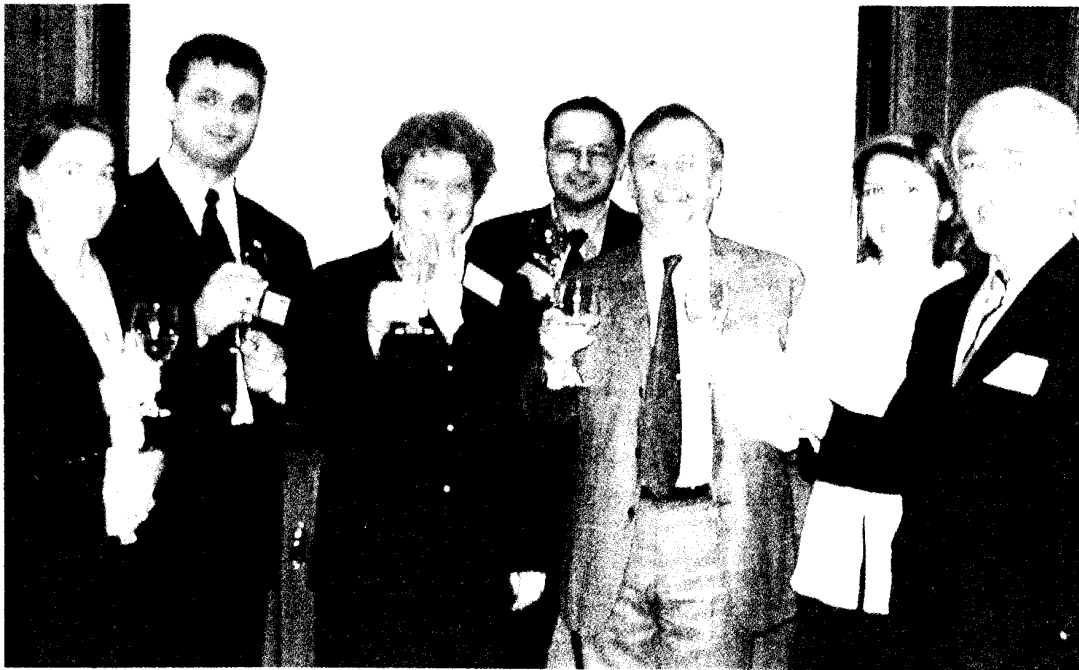
Slika 6: Predstavniki novo vključenih NPO z generalnim sekretarjem EFQM g. Alainom de Donnartinom