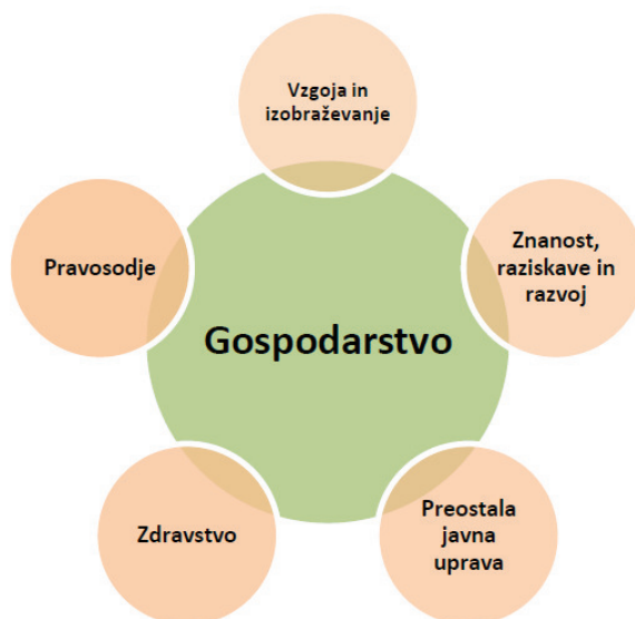
Slika 3: Povezovanje deležnikov (Strategija poslovne odličnosti 2018 – 2030, str. 5)

Za državo je pomembno, da ima kar se da odlične organizacije, za zagotavljanje višje konkurenčnosti nacionalnega gospodarstva ter prek tega boljšega življenja vseh. Pomembno je načrtno delovanje, da bi se čim več organizacij odločilo za pot poslovne odličnosti, ter prek aplikacije koncepta oziroma modela odličnosti izboljševalo vse segmente svojega poslovanja, dosegalo boljše rezultate ter prek tega prispevalo k trajnostni prihodnosti Slovenije (Žurga, 2018). Pri tem je pomembno organizacije spodbujati in motivirati, da se na svoji poti odličnosti ocenijo oziroma preverijo doseženo stopnjo poslovne odličnosti. Preveritev dosežene stopnje je za organizacijo pomembno za načrtovanje njenega nadaljnjega delovanja, projektov in dejavnosti izboljševanja in razvoja. Ob tem pa organizacija izboljšuje in razvija tudi svoj sistem menedžmenta organizacije.